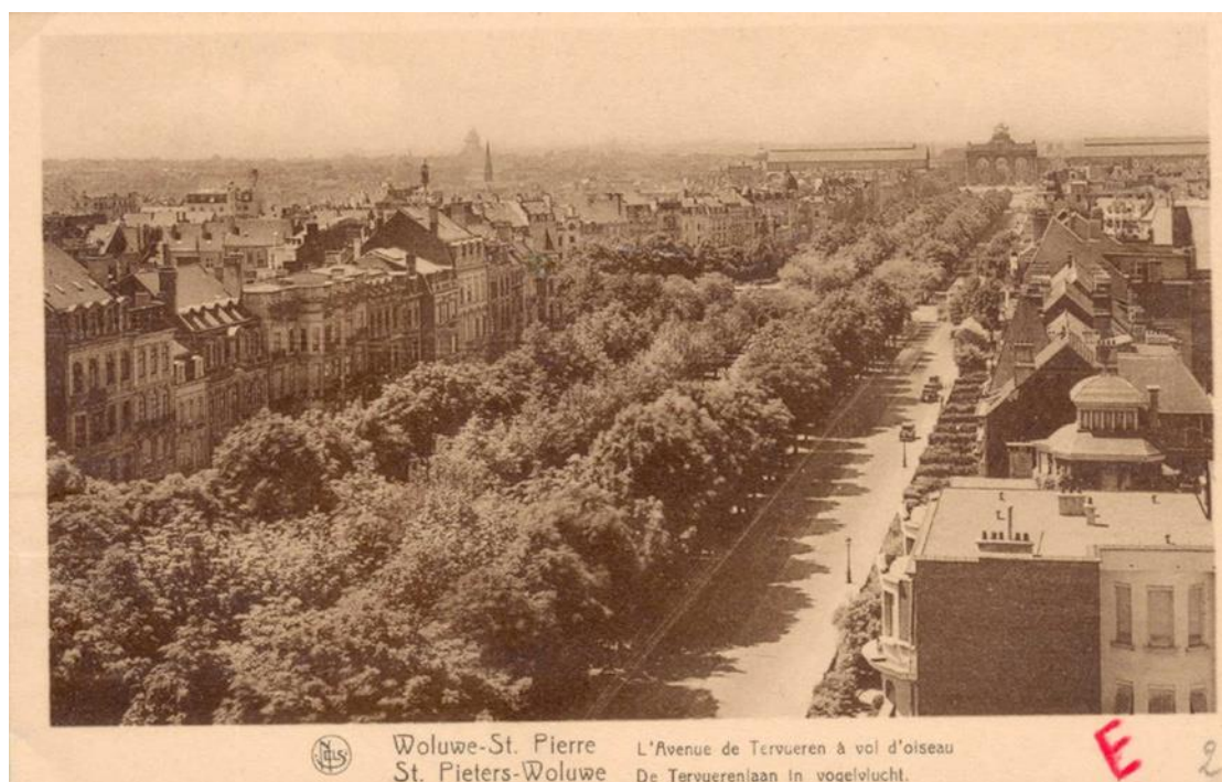
Alignements d'arbres sur l'avenue de Tervueren avant la construction des tunnels, vus depuis le n°196 (ou le 194B à sa construction) : source : patrimoine.brussels.

Une fois de plus, tout et n'importe quoi est tenté dans la Note pour supprimer un maximum de places de parking.